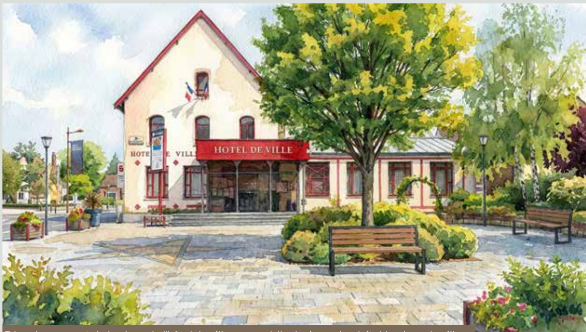
Réaménagement de la place de l'hôtel de ville pour qu'elle devienne la véritable place du village