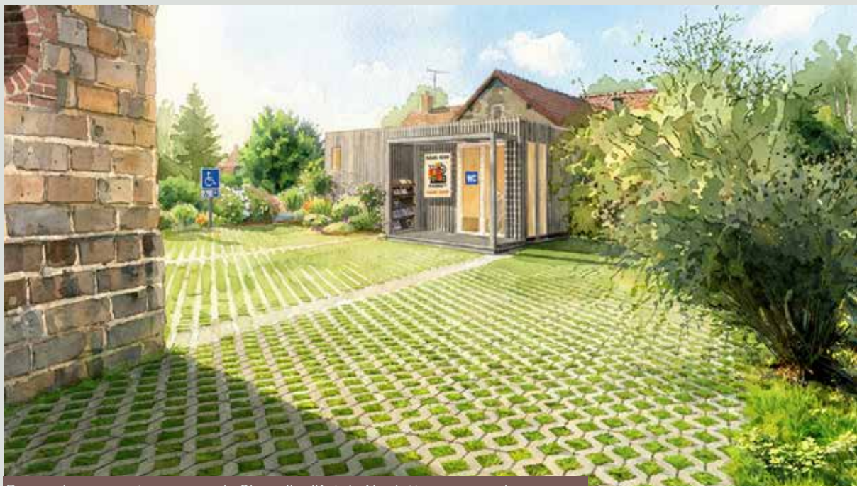
Des aménagements pour que la Chapelle d'Art de Noulette rayonne plus encore