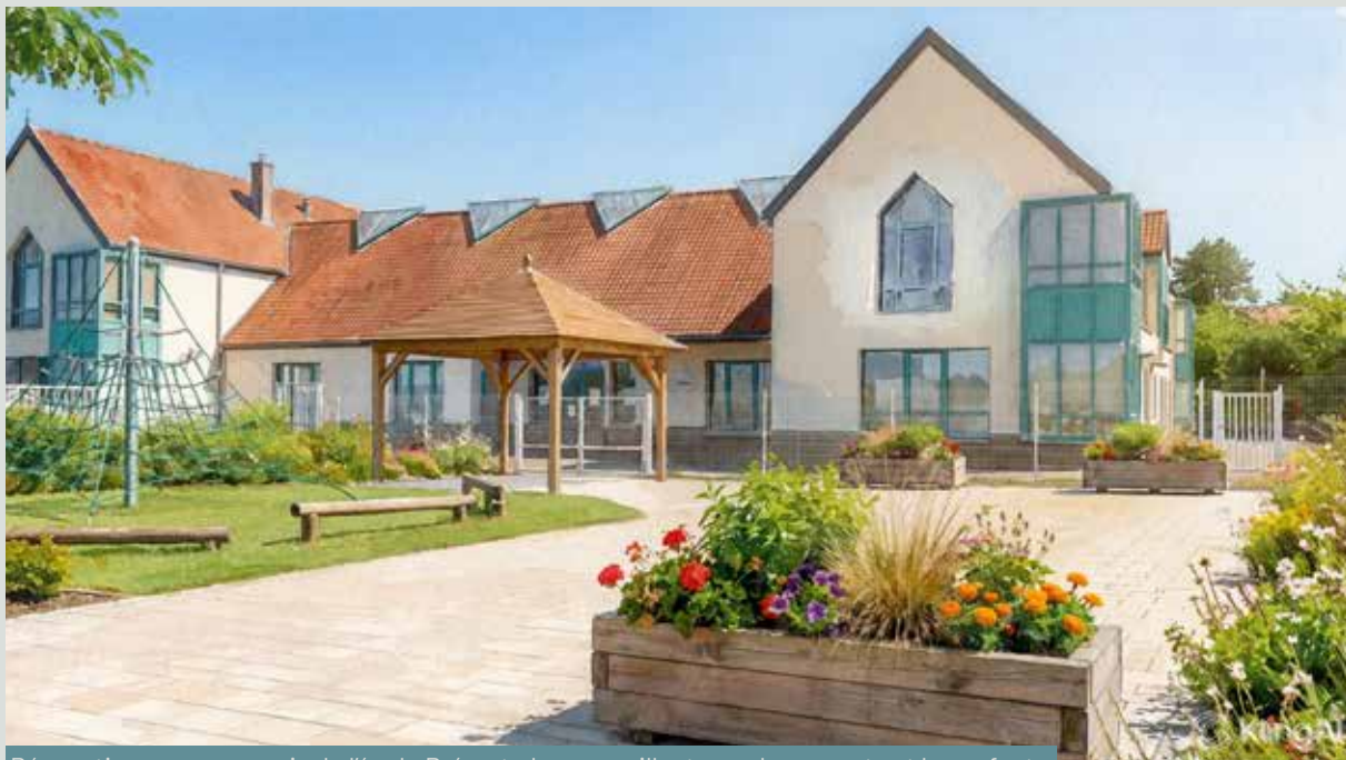
Rénovation pour un parvis de l'école Prévert plus accueillant pour les parents et les enfants