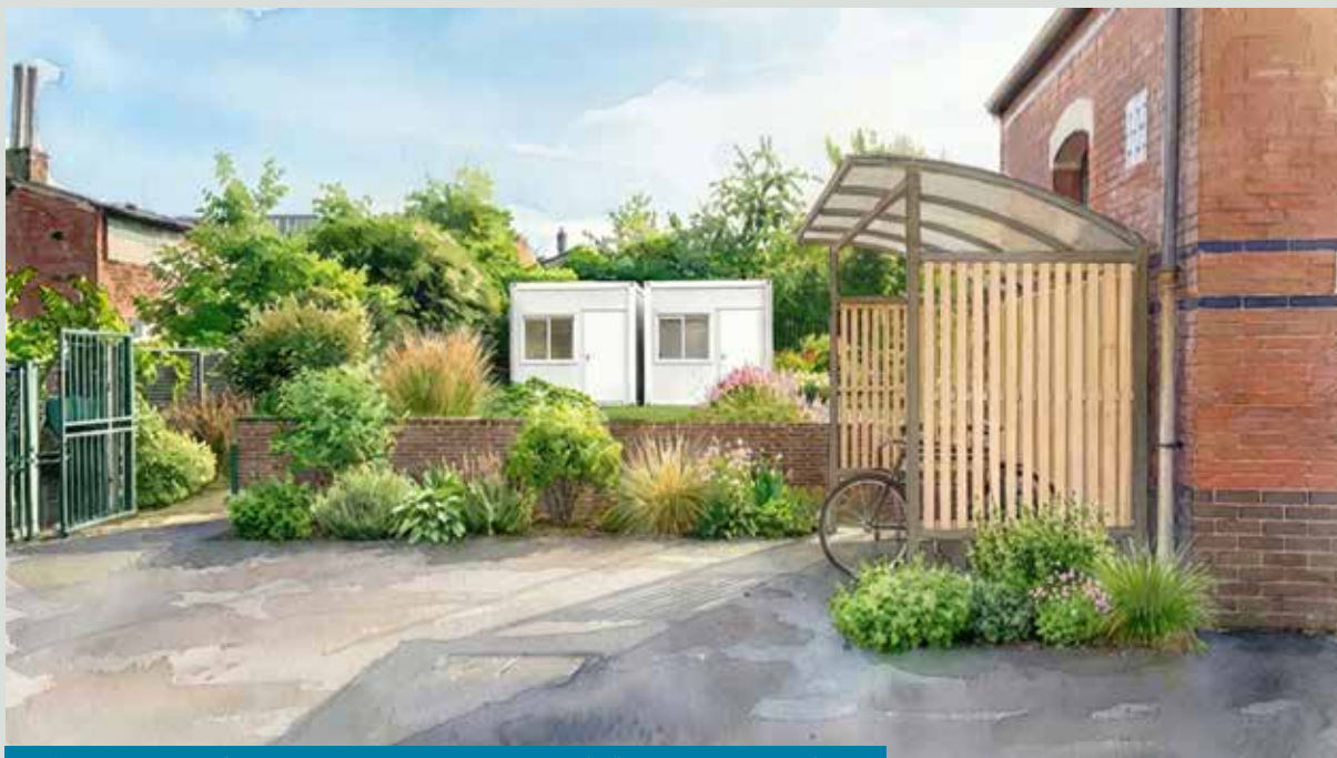
Aménagement de lieux de stockage pour les associations dans leur Maison