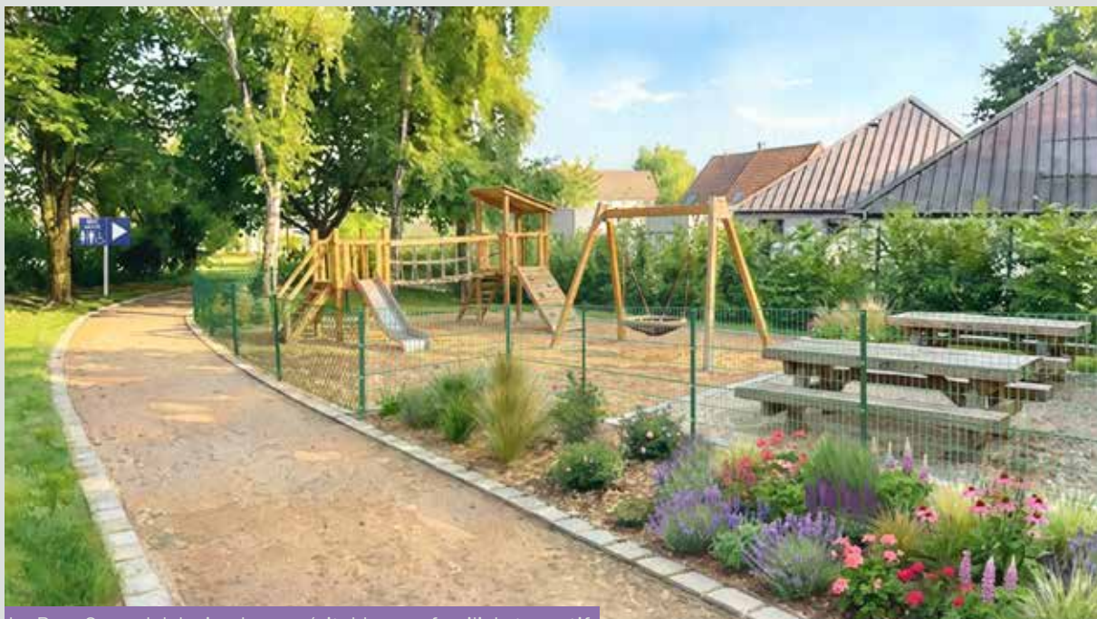
Le Parc Garandel deviendra un véritable parc familial et sportif