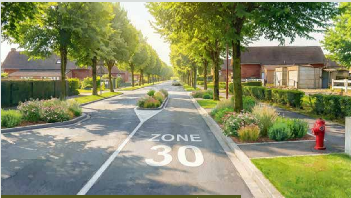
Combiner sécurisation routière et végétalisation de la commune (Bd de Rouen)