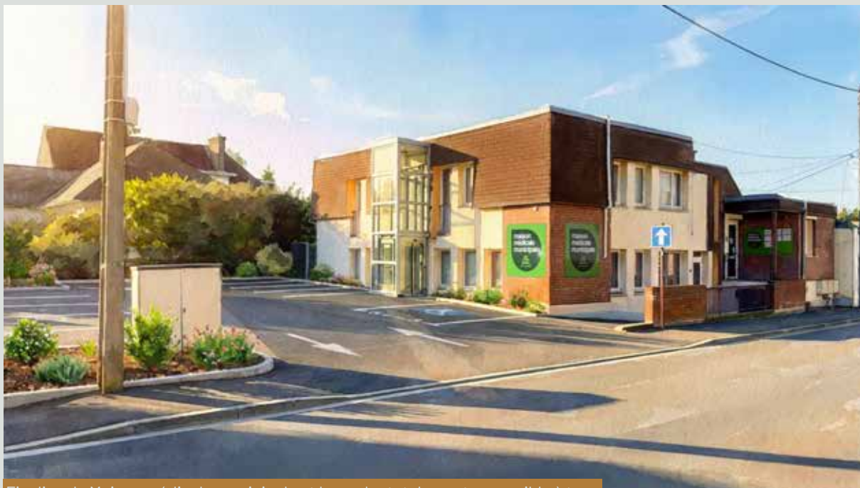
Finaliser la Maison médicale municipale et la rendre totalement accessible à tous